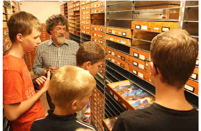
Rondleiding in de collectie van Naturalis