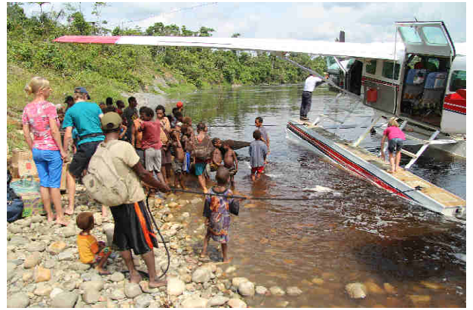
Aankomst in Sinimburu