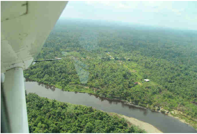
Sinimburu vanuit de lucht