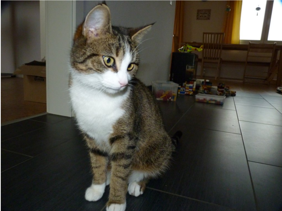
Lili (door Anea)

wandelen. Op regenachtige dagen speelden ze met mijn foto camera en hebben grappige foto's gemaakt (zie hier boven). Barbara en ik waren tegelijk verkouden en konden dus rusten terwijl mijn ouders op de kinderen pasten. Anea wilde eigenlijk niet naar huis, de tijd was veel te snel om. We vertrokken om 5 uur 'smorgens zodat we na zo'n 8 uur rijden 'smiddags rond 2 uur thuis waren. Dan konden de kinderen weer een beetje wennen en spelen na zo lang in de auto te hebben gezeten.